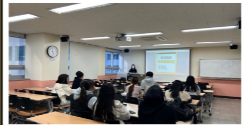
4학년 학생과의 멘토링