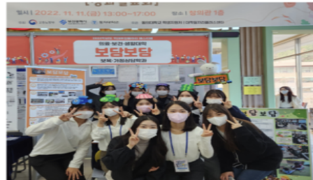
취업동아리 성과 발표회