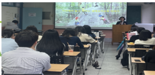
보육교사 역량 강화를 위한 특강 진행