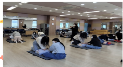
전공관련 자격증 이수